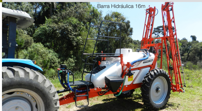
Barra Hidráulica 16m

Rodados versátiles, compatibles a las necesidades del campo. Disponible en tres modelos: 9,5 X 24"; 12,4 x 36" o tandem 900 X 20. Confiera la tabla de características para saber la compatibilidad.