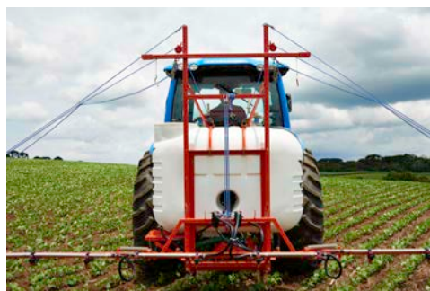
ALTURA ADECUADA LÍNEA GARDIEN C

Chasis y cuadro componen un conjunto de alta performance. Son resistentes a las más severas condiciones de trabajo, garantizando seguridad en cualquier operación.