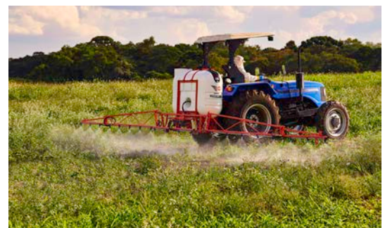
ECONOMIA CALIDAD EN LA APLICACIÓN

El conjunto torre de la línea Gardien C posibilita varios ajustes de altura, que pueden llegar hasta 1,65 metros. Con la practicidad que el agricultor necesita, es posible realizar estos ajustes sin necesidad de herramientas.