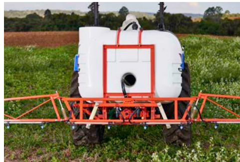
RESISTENCIA COMPROBADA CUADRO GARDIEN X

Chasis y cuadro componen un conjunto de alta performance. Son resistentes a las más severas condiciones de trabajo, garantizando seguridad en cualquier operación.